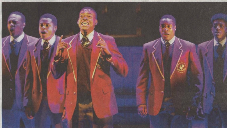
Choir Boy balanced lush visual and verbal poetry with humour and yearning pain at Centaur Theatre.

My favourites from the Montreal Clown Festival at MainLine included the touching Steinbeck spoof Of Mice and Morro and Jasp , and the precise physical